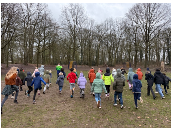
Kinderen die meedoen aan de Kidsrun op 12 april hebben drie vrijdaggen een half uur hardlooptraining in het Crossbos