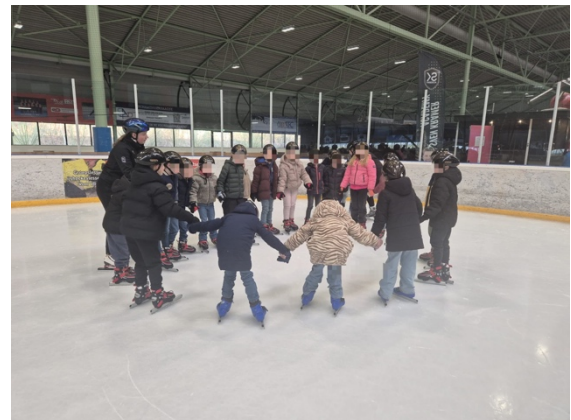
De midden- en bovenbouwgroepen hebben in maart schaatsles gehad in de IJshal in Enschede