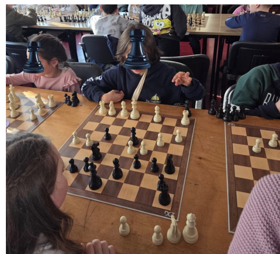
Kinderen uit groep 3 t/m 8 hebben meegedaan met het Enschedese scholen schaaktoernooi.