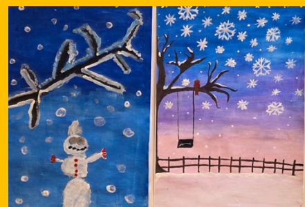
Winterse kunst uit de bovenbouw